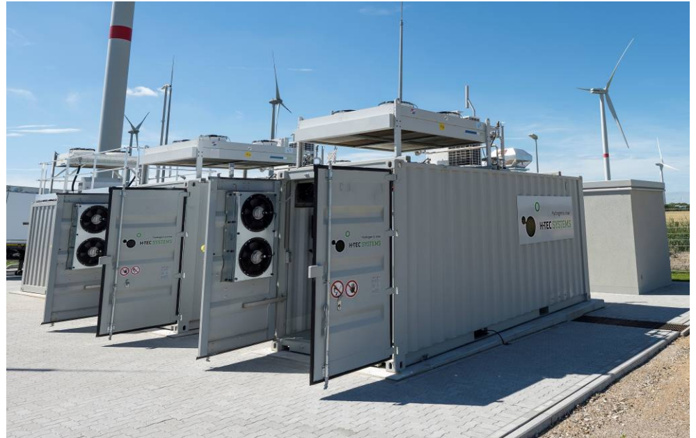
PEM-Elektrolyseure von H-TEC SYSTEMS wandeln erneuerbare Energie in grünen Wasserstoff um

MAN Energy Solutions ebnet den Weg in eine klimaneutrale Weltwirtschaft. Ob Industrieproduktion, Energie- oder maritime Wirtschaft: Wir denken ganzheitlich und packen schon heute die Herausforderungen von morgen an – für eine nachhaltige Wertschöpfung unserer Kunden. In unserem Technologieportfolio steckt die Erfahrung aus über 250 Jahren Ingenieurstradition. MAN Energy Solutions hat seinen Hauptsitz in Deutschland und beschäftigt rund 14.000 Mitarbeiter an mehr als 120 Standorten weltweit. Unsere Kunden profitieren außerdem vom globalen Service-Center-Netzwerk unserer After-Sales Marke, MAN PrimeServ.