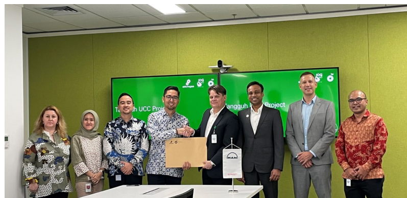
bp Indonesia und MAN Energy Solutions bei der Unterzeichnung des Vertrags für die Lieferung der Kompressortechnologie für das Tangguh EGR/CCUS-Projekt

MAN Energy Solutions ebnet den Weg in eine klimaneutrale Weltwirtschaft. Ob Industrieproduktion, Energie- oder maritime Wirtschaft: Wir denken ganzheitlich und packen schon heute die Herausforderungen von morgen an – für eine nachhaltige Wertschöpfung unserer Kunden. In unserem Technologieportfolio steckt die Erfahrung aus über 250 Jahren Ingenieurtradition. MAN Energy Solutions hat seinen Hauptsitz in Deutschland und beschäftigt rund 14.000 Mitarbeiter an mehr als 120 Standorten weltweit. Unsere Kunden profitieren außerdem vom globalen Service-Center-Netzwerk unserer After-Sales Marke, MAN PrimeServ.